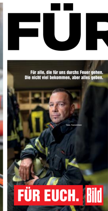
FÜR EUCH. Bild