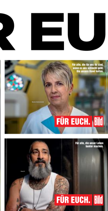
FÜR EUCH. Bild