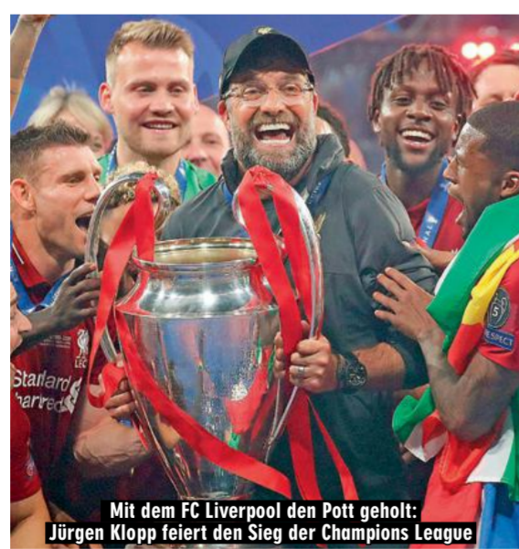
Mit dem FC Liverpool den Pott geholt: Jürgen Klopp feiert den Sieg der Champions League

Darin sind alle Infos zu den Champions-League-Teilnehmern und natürlich zu Jürgen Klopp und dem FC Liverpool, der als Titelverteidiger ins Rennen geht, enthalten. Der normale SPORT BILD-Ausgabe liegt am 11.9. eine Gratis-Beilage mit allen Transfers des Sommers. Damit sind echte Fußball-Fans auf dem aktuellen Stand.