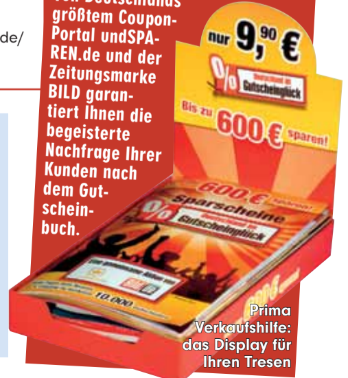
Prima Verkaufshilfe: das Display für Ihren Tresen

Fragen Sie Ihren Grossisten danach! Um Ihren Verkauf zu unterstützen, startet im November eine große Werbekampagne in BILD, BILD am SONNTAG, BILD.de und B.Z. Die Vermarktungskoopeation von Deutschlands größtem Coupon-Portal und SPAREN.de und der Zeitungsmarke BILD garantiert Ihnen die begeisterte Nachfrage Ihrer Kunden nach dem Gutscheinbuch.