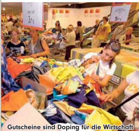
Gutscheine sind Doping für die Wirtschaft

Erst in den USA, jetzt in Deutschland: Coupons gewinnen immer mehr an Bedeutung, denn sie stärken die Außenwirkung der Unternehmen. Das gilt für die beteiligten Firmen, die Rabatte gewähren, aber auch für Sie, liebe Händler. Dabei wird der größte Nutzen in der Neukundengewinnung und Kundenbindung gesehen. Wenn Sie Ihren Kunden das Gutscheinbuch anbieten, sparen Ihre Kunden an anderer Stelle und sind Ihnen dankbar für diesen Tipp.