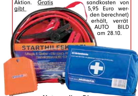
Notwendige Dinge die jeder Autofahrer braucht

Käufer von AUTO BILD Ausgabe 43 (EVT 28.10.) werden sich freuen: Das Heft bietet in Zusammenarbeit mit „kfzteile24“ eine sensationelle Aktion. Gratis gibt es eine Verbandstasche (Wert ca. 10 Euro), Starthilfekabel (Wert ca. 10 Euro) und einen Eiskratzer. Wie man diese tollen Dinge gratis (nur Versandkosten von 5,95 Euro werden berechnet) erhält, verrät AUTO BILD am 28.10.