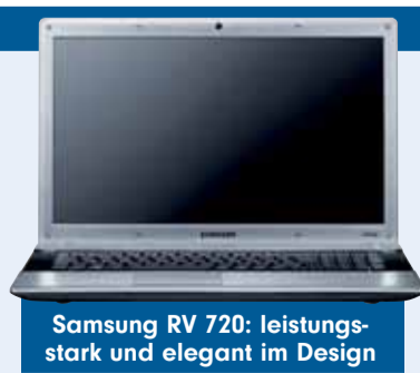
Samsung RV 720: leistungsstark und elegant im Design

ACHTUNG, WICHTIG: Geben Sie bitte Ihren Absender vollständig an und vermerken Sie unbedingt Ihren Grossisten oder Bahnhofsbuchhändler. Alle Einsendungen mit der richtigen Lösung nehmen an der Verlosung teil. Einsendeschluss ist der 23. Oktober 2011.