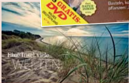
Das neue Heft von HÖRZU HEIMAT erscheint am 5.10.