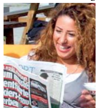
BILD – die XXL-Marke mit XXL-Erfolg

98 Prozent der Deutschen kennen BILD. BILD hat mehr jugendliche Leser als BRAVO, mehr weibliche als BRIGITTE und mehr Professoren und Akademiker unter ihren Lesern als die FAZ.