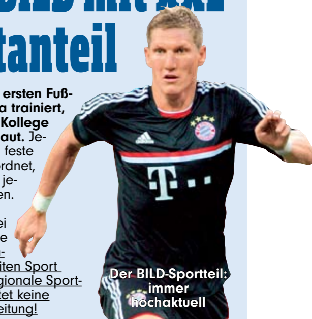
Der BILD-Sportteil immer noch aktuell

Kein Team der ersten Fußball-Bundesliga trainiert, ohne dass ein Kollege von BILD zuschaut. Jedem Team sind feste Reporter zugeordnet, die natürlich zu jedem Spiel fahren. So sind immer mindestens zwei BILD-Redakteure im Stadion. Mindestens vier Seiten Sport täglich, dazu regionale Sportseiten. Das leistet keine andere Tageszeitung!