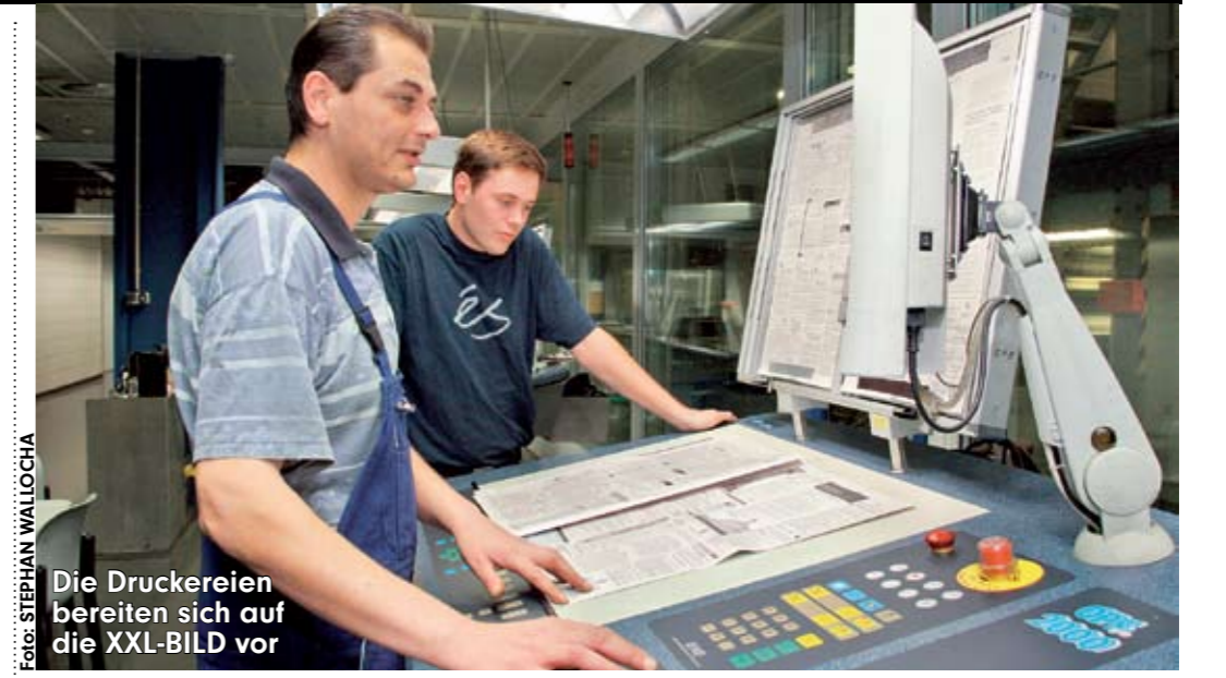
Die Druckereien bereiten sich auf die XXL-BILD vor

Druckkapazität als normal üblich. Dieses wird realisiert durch den Einsatz zusätzlicher Maschinen und auch durch längere Druckzeiten. Auch im Ausland können einige Druckereien nicht genutzt werden. Von den insgesamt 24 BILD-Druckorten können 6 die XXL-BILD nicht drucken und nahe liegende Druckereien müssen einspringen. So werden wir z.B. die Auflage für Mallorca in Madrid drucken und von dort nach Mallorca fliegen, damit auch