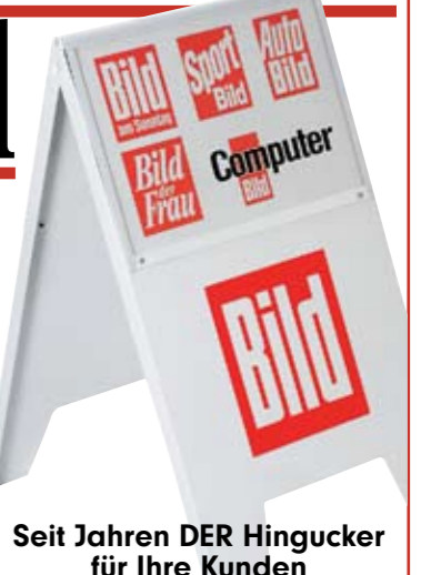
Seit Jahren DER Hingucker für Ihre Kunden

Die Aufstelltafel der BILD-Gruppe: Wussten Sie, dass im Jahr 2011 pro Tag durchschnittlich 119 Aufstelltafeln des Vertriebs BILD-Gruppe und Zeitschriften im Pressehandel platziert werden? Wir finden: Die BILD-Aufstelltafel ist das „XXL-Werbemittel des Jahres“.